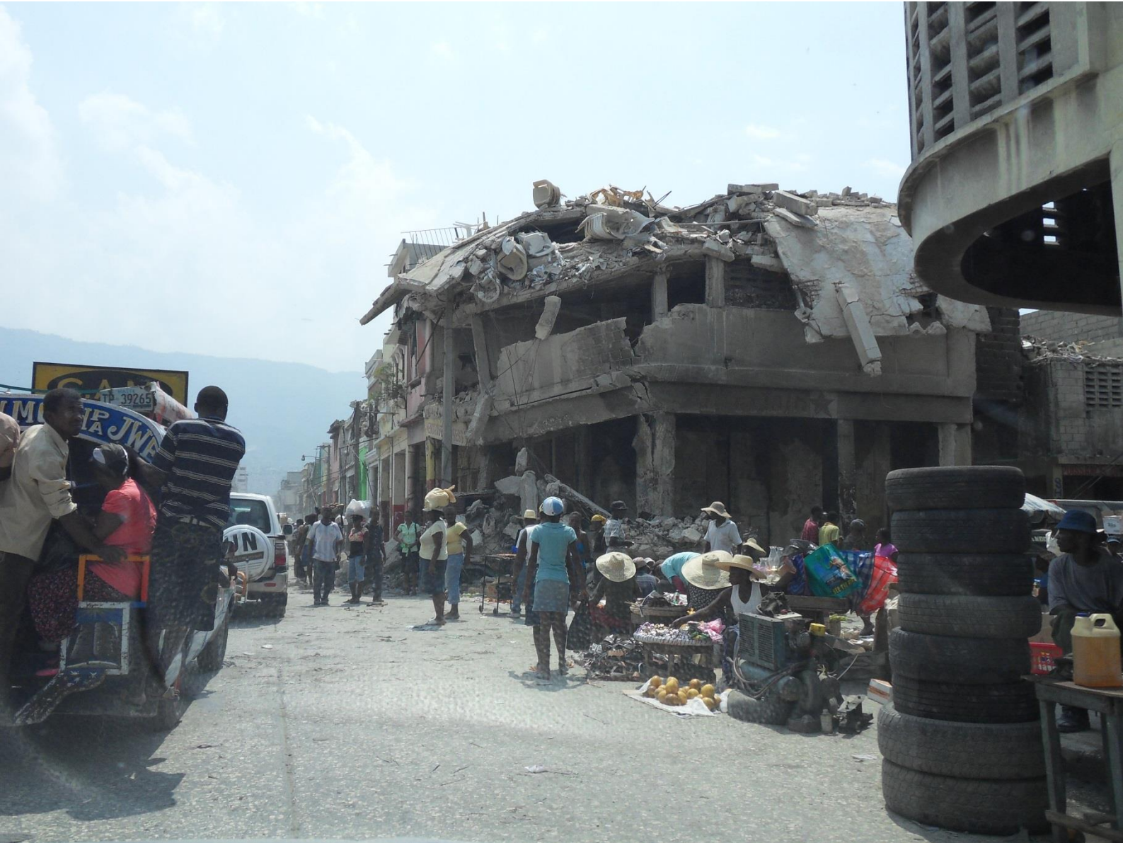
Arriba: una calle en el centro de Puerto Príncipe muestra la magnitud de la destrucción, marzo 2010