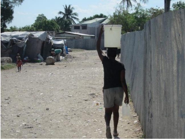
Arriba : Campo Grace Village, municipio Carrefour, Puerto Príncipe, abril 2013.