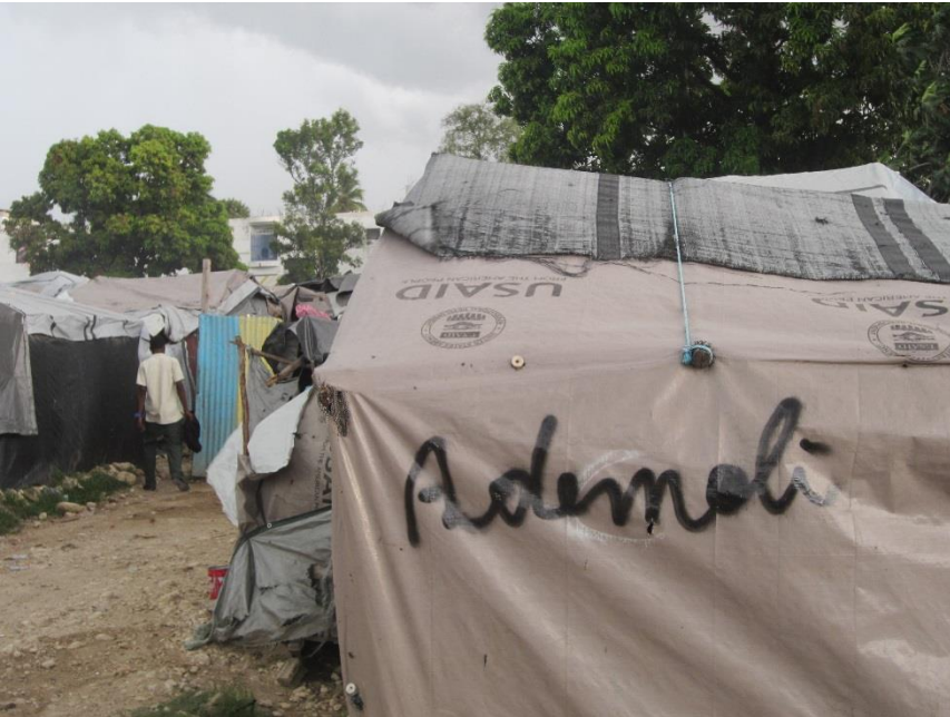
Arriba: Refugio temporal marcado "Ademoli" ("para ser demolido"), campamento Grace Village, municipio Carrefour, Puerto Príncipe, mayo de 2012. Dichas marcas son a menudo la única advertencia dada a las familias antes del desalojo.