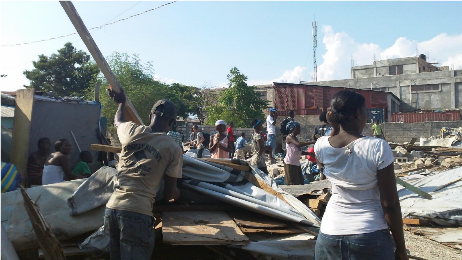
Arriba: desalojo forzoso en el Campo Mozayik, municipio de Delmas, Puerto Príncipe, mayo 2012.