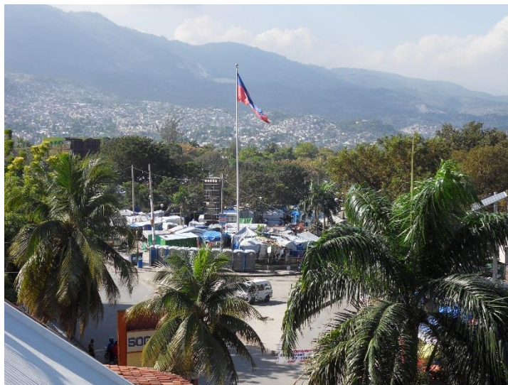
Abajo: refugios improvisados en Camp Palais de l'Art, municipio de Delmas, Puerto Príncipe, septiembre de 2011.