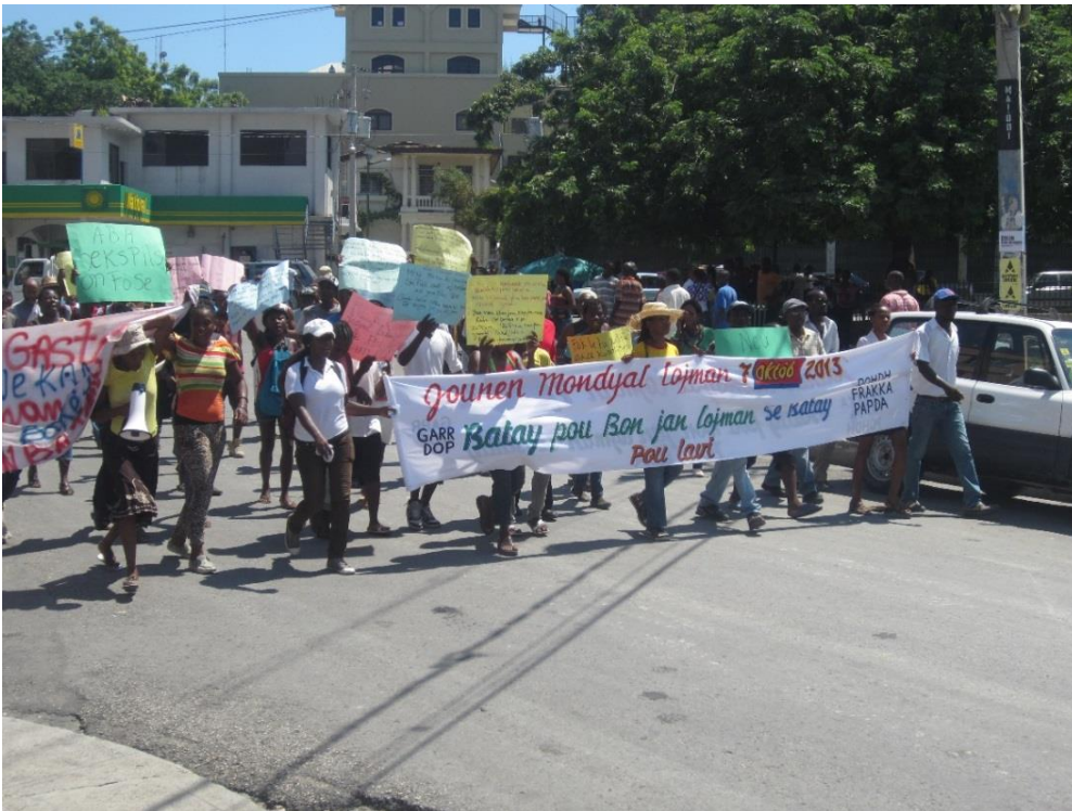
Abajo: manifestación para conmemorar el Día Internacional del Hábitat, Puerto Príncipe, octubre 2013.