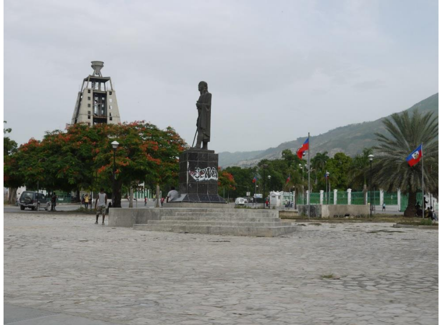
Abajo: Champs de Mars después de la eliminación de los refugios temporales, julio 2012