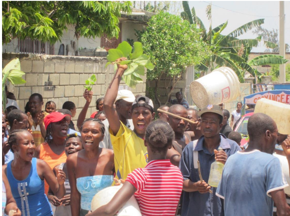
Abajo: manifestación de los residentes de un campo amenazados de desalojo forzoso. Campo Grace Village, municipio Carrefour, Puerto Príncipe, mayo 2012.