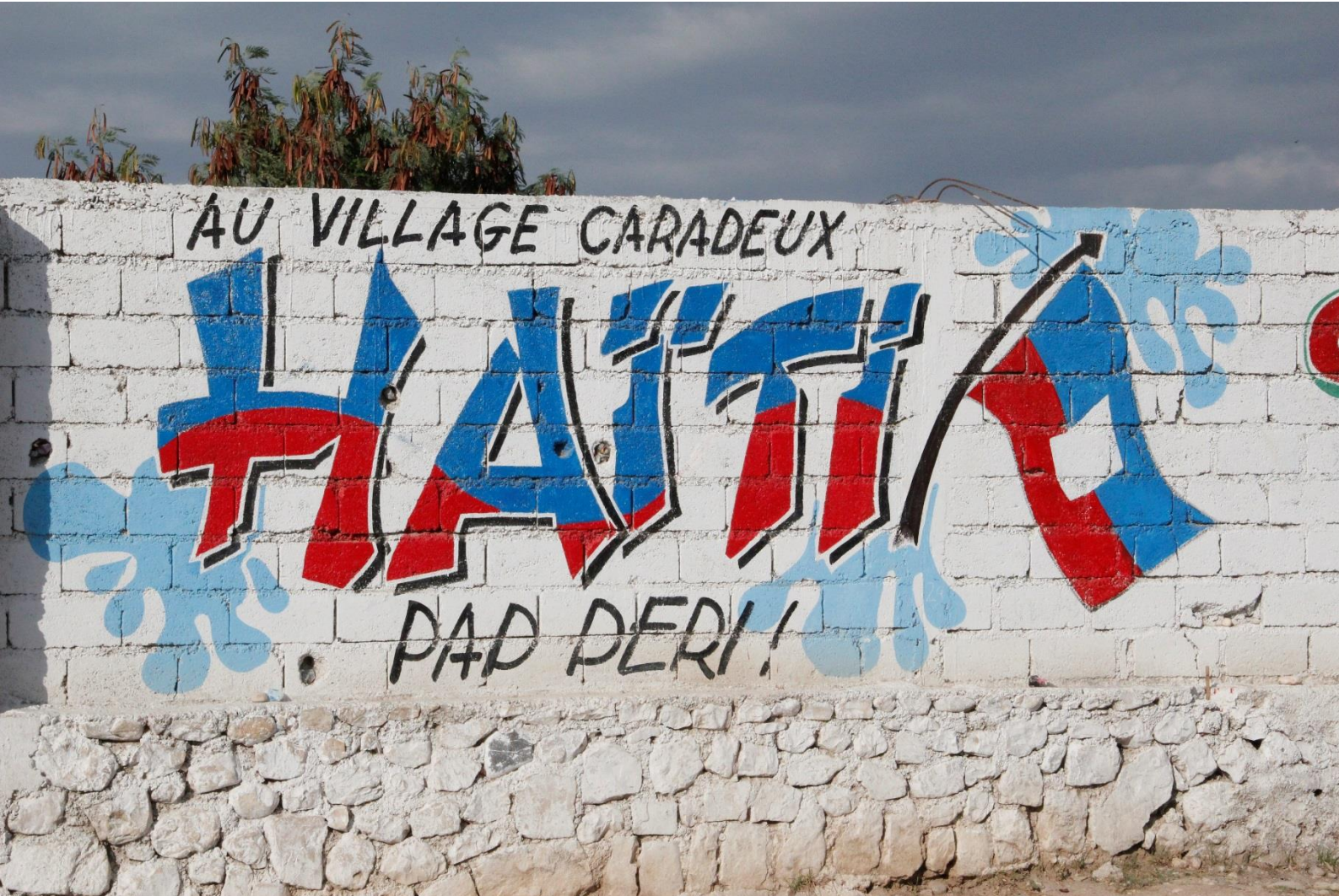
Mural que lee : "En la aldea de Carradeux, ¡Haití vive!", Campamento Carradeux, Puerto Príncipe, septiembre de 2014.

Todas las fotografías son propiedad de Amnistía Internacional, excepto cuando se especifique privado.