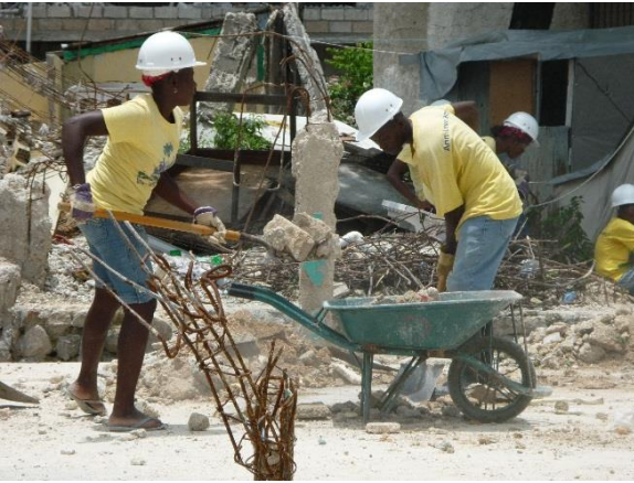
Arriba: jornaleros limpiando los escombros causados por el desastre, junio 2010